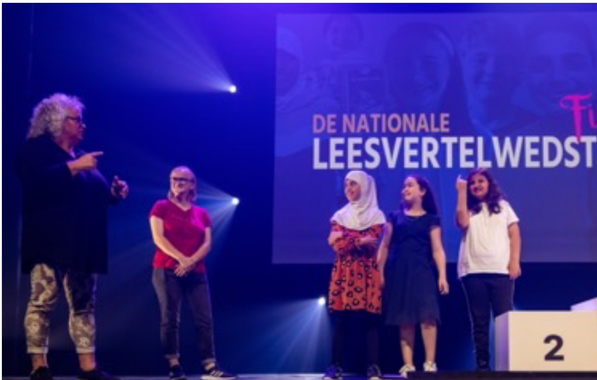
De jury is klaar om de winnaars aan te wijzen