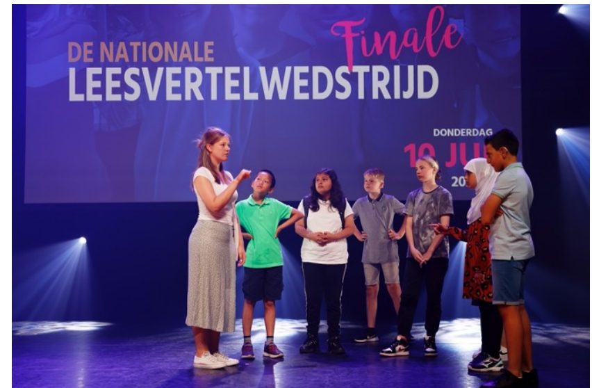
De finalisten krijgen een 'doorloop' op het podium

In deze eindrapportage lichten we de uitwerking van het oorspronkelijke plan toe, reflecteren we op de behaalde resultaten en laten vooral ook veel betrokkenen aan het woord. Zowel lovende als kritische opmerkingen nemen we mee in de plantontwikkeling van volgend jaar wanneer De Nationale LeesVertelwedstrijd voor de 25ste keer georganiseerd zal worden. Daar maken we heel graag iets heel bijzonders van en we zien er enorm naar uit.