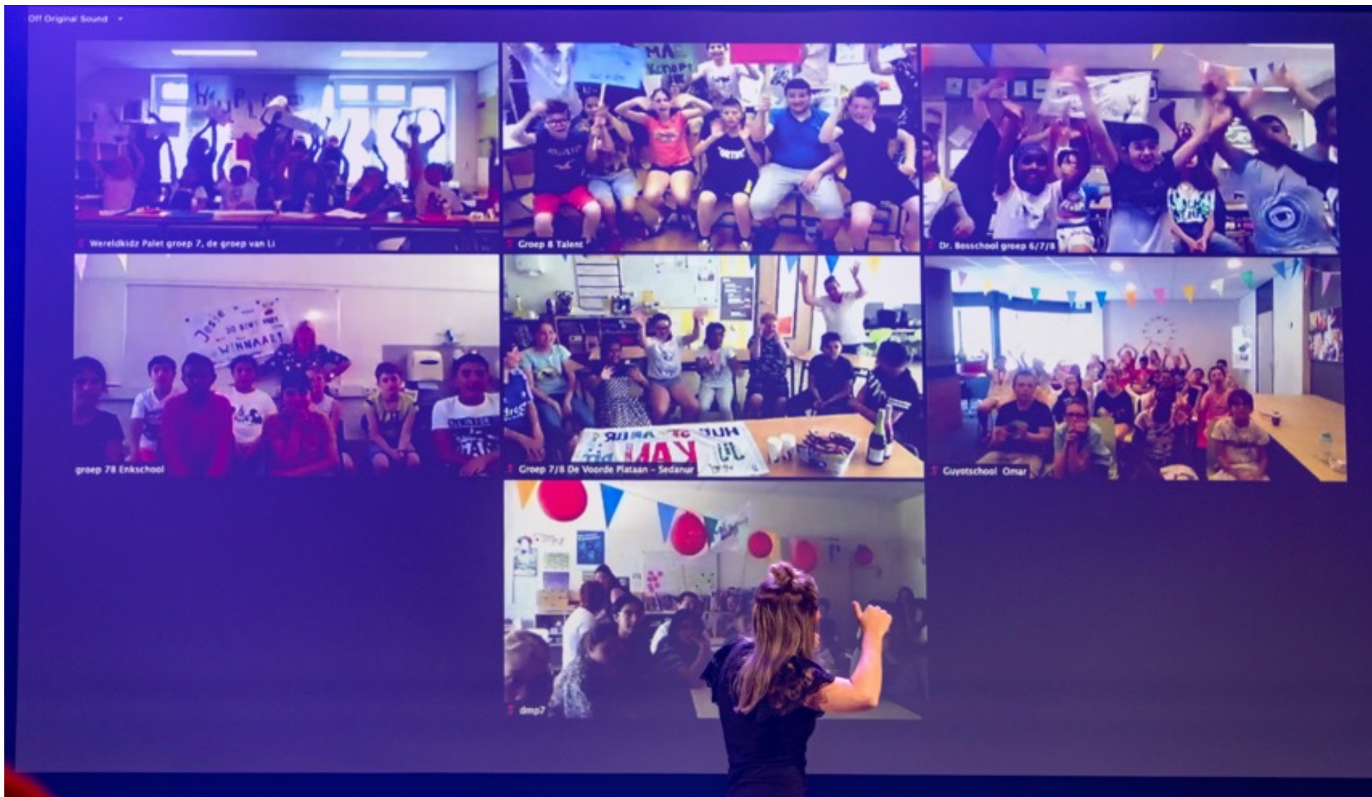
Klasgenoten zijn real-time aanwezig om 'hun' finalist aan te moedigen