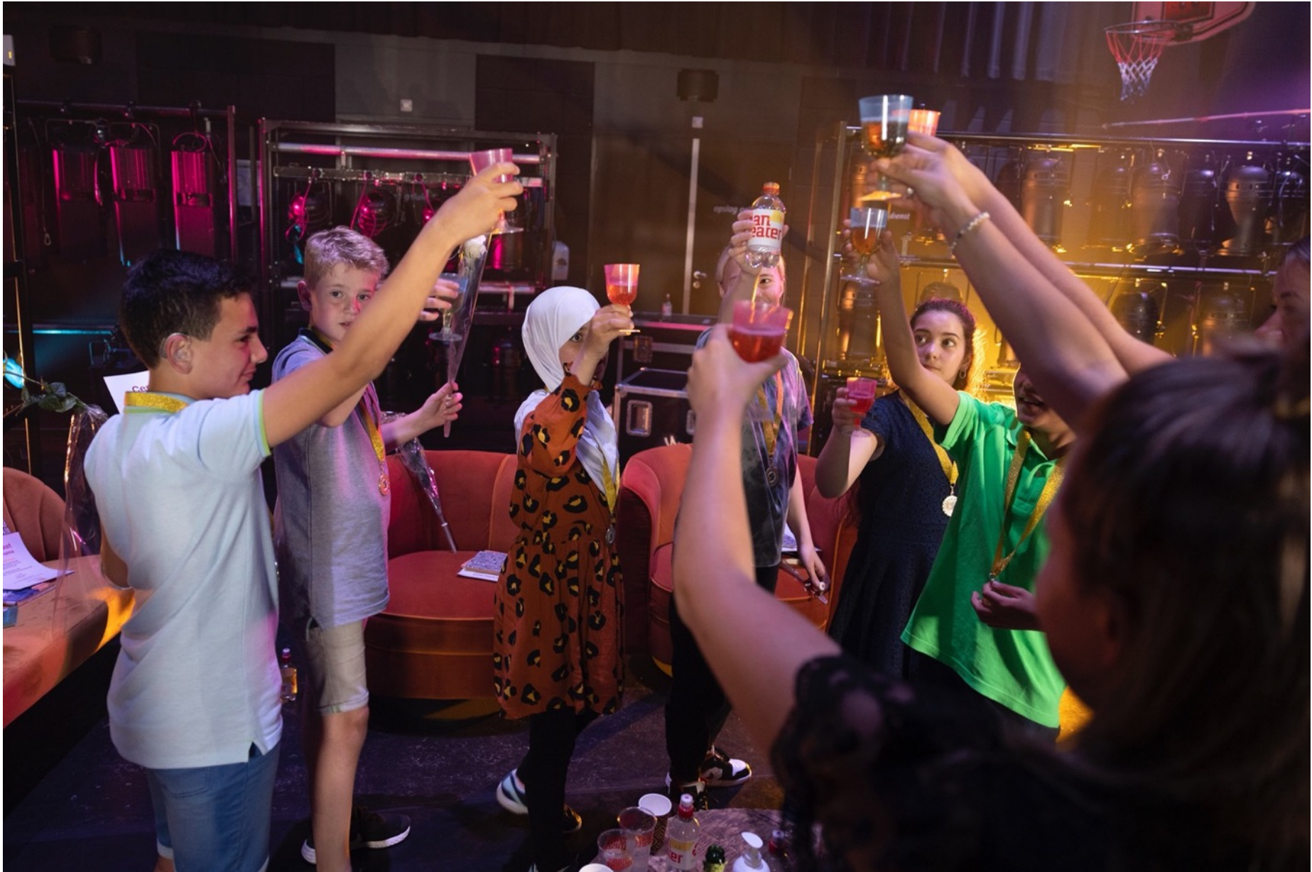
De finalisten proosten na afloop van de spannende finale