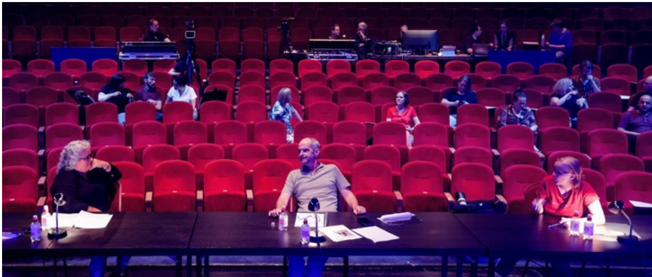
< De jury overlegt op anderhalve meter afstand