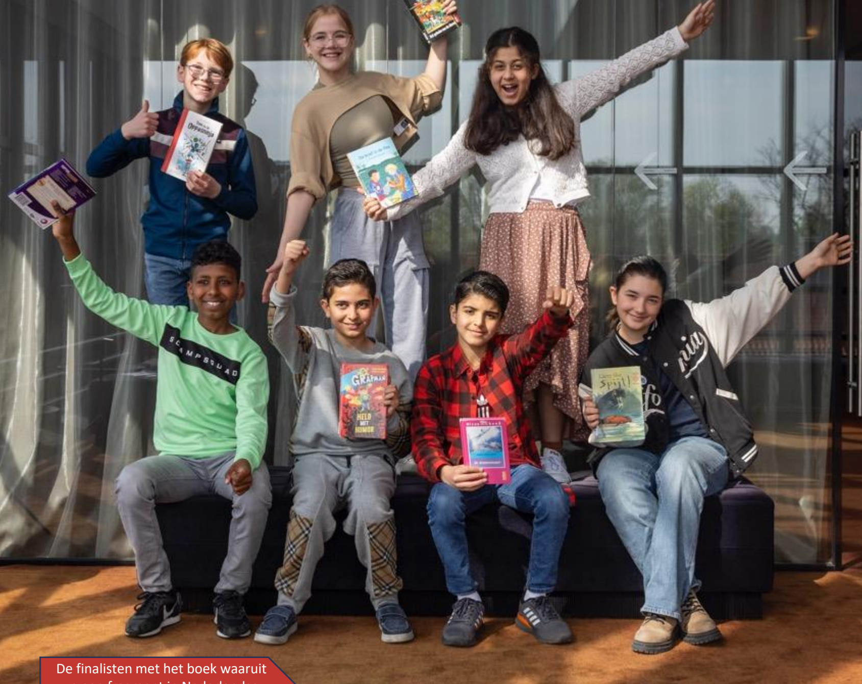
De finalisten met het boek waaruit ze een fragment in Nederlandse Gebarentaal gaan voordragen